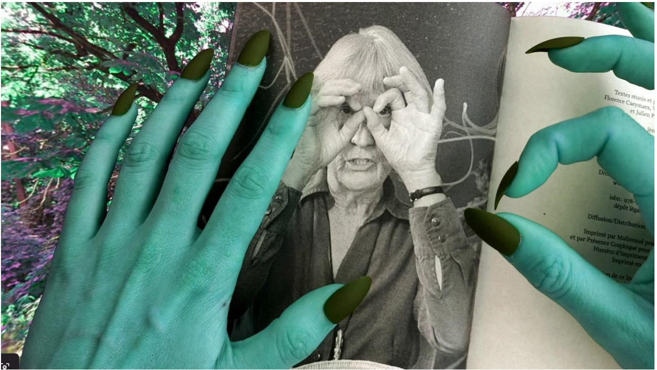
Le Quinzième jour, recherche-cr ation, production Les Champs Libres, 2020