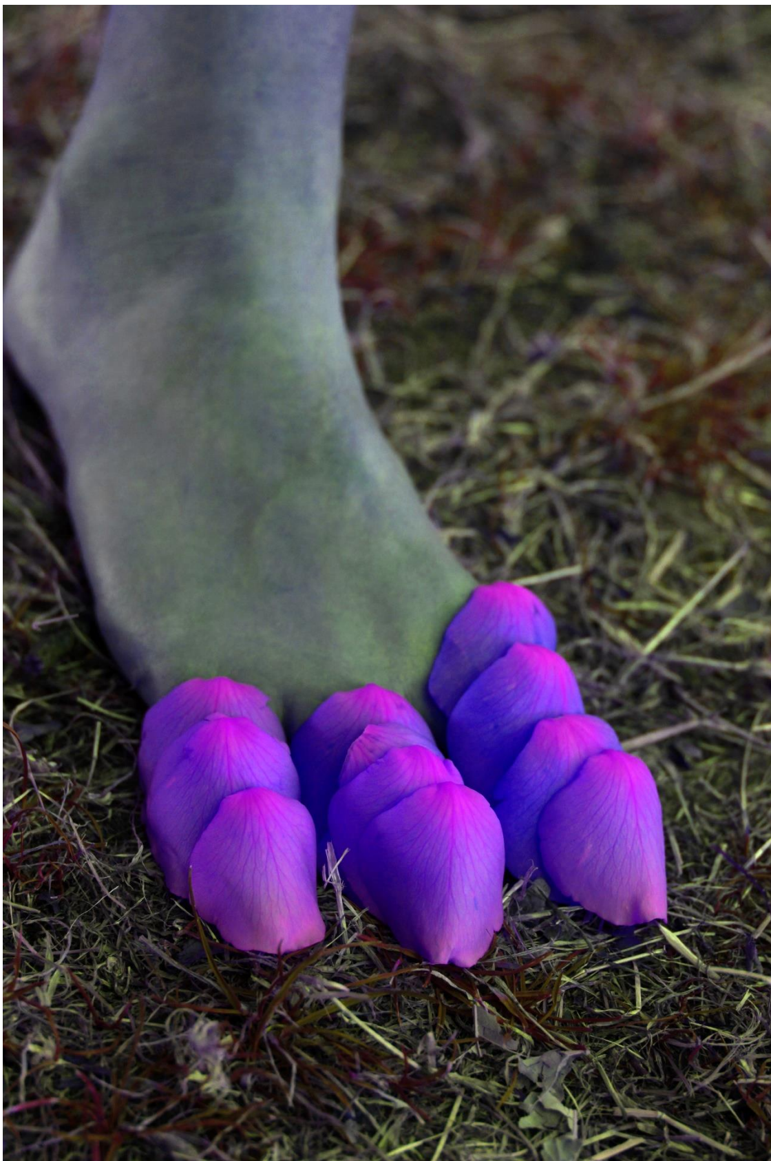
Le Quinzième jour , recherche-cr ation, production Les Champs Libres, 2020