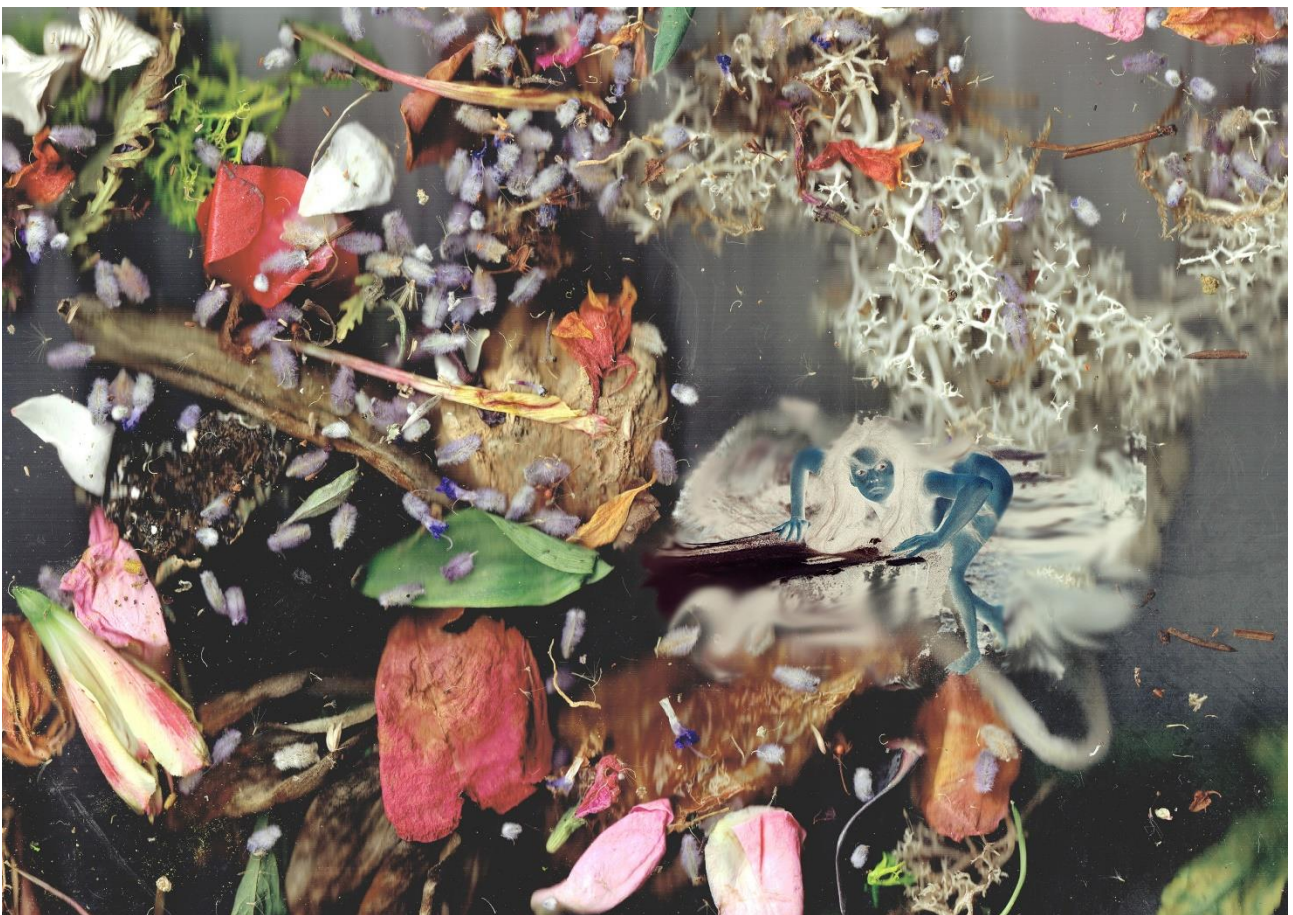
Johanna Rocard, Les enfant-es du compost , 2023

Exposition du 20 octobre au 1 er décembre 2023