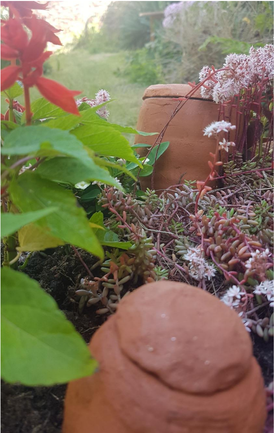
Gwenn Mérel, Oyas, sculpture en terre cuite, 2023