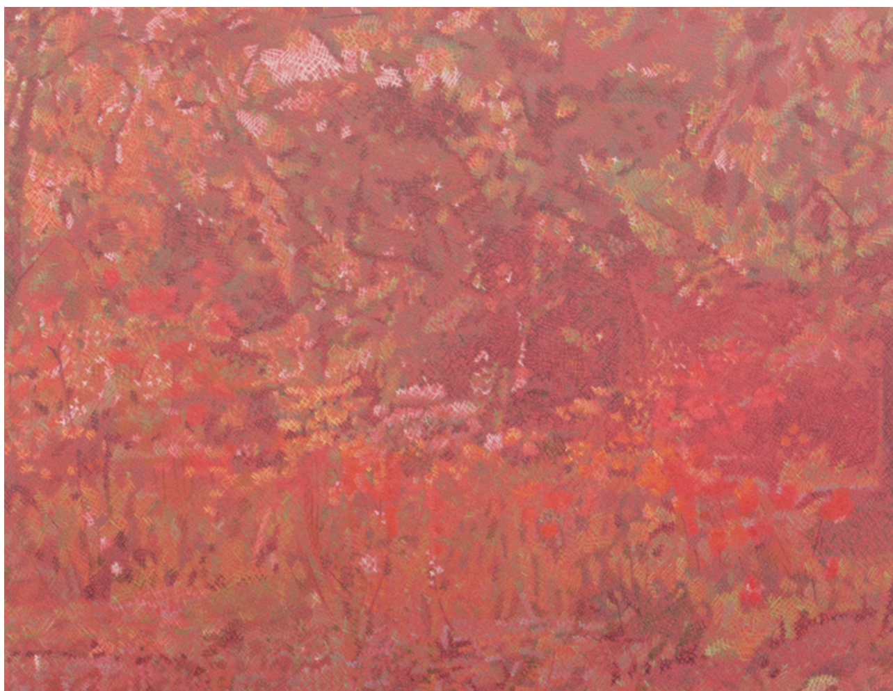
Gwenn Mérel, Britzer Garten, Berlin (détail), crayons de couleur sur papier coloré, 2022

Performance Ces nuages qui courent là-bas... à 16h et vernissage à 18h30 le mercredi 5 juillet