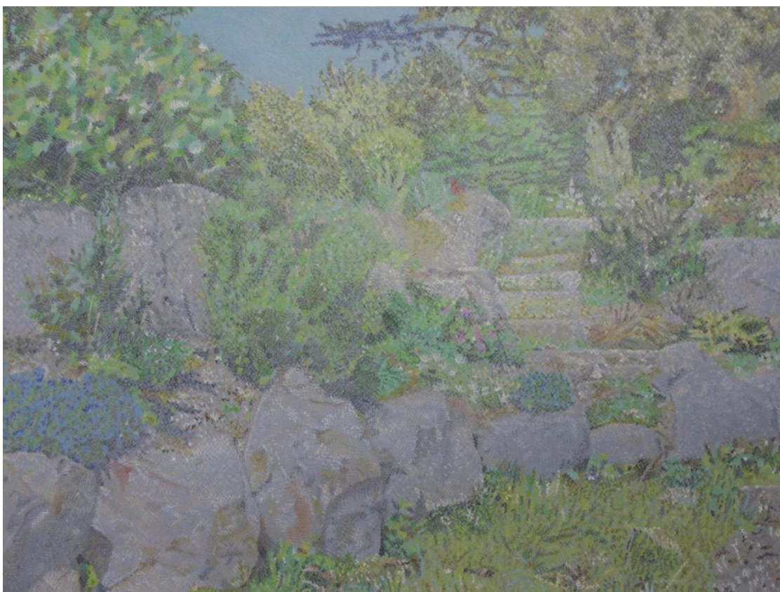
Gwenn Mérel, Cancale, Le Hock , crayons de couleurs sur papier coloré, 40x30 cm, 2020 Collection FRAC Bretagne