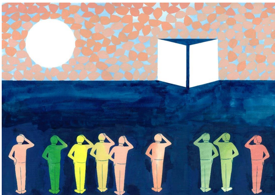
Mathilde Rives, série L'horizon de la ligne , 2020. Gouache sur papier, 29,7 x 42 cm.