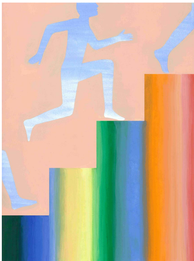
Mathilde Rives, série L'horizon de la ligne , 2020. Gouache sur papier, 21 x 29,7 cm.