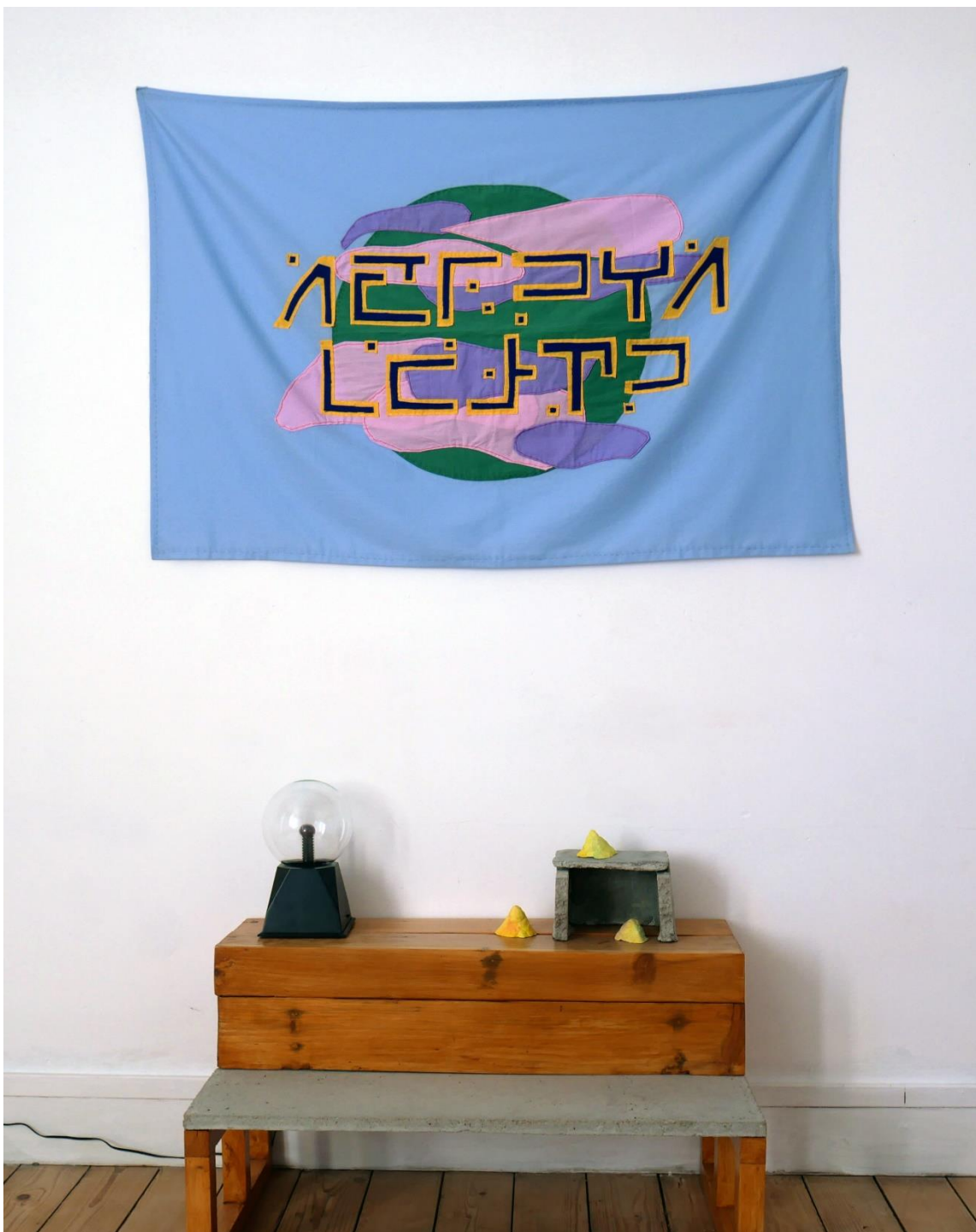
Martha dans l'espace (détail d'installation), 2018

Drapeau en toile de coton, étagère en béton et bois, lampe plasma, argile et béton, dimensions variables.