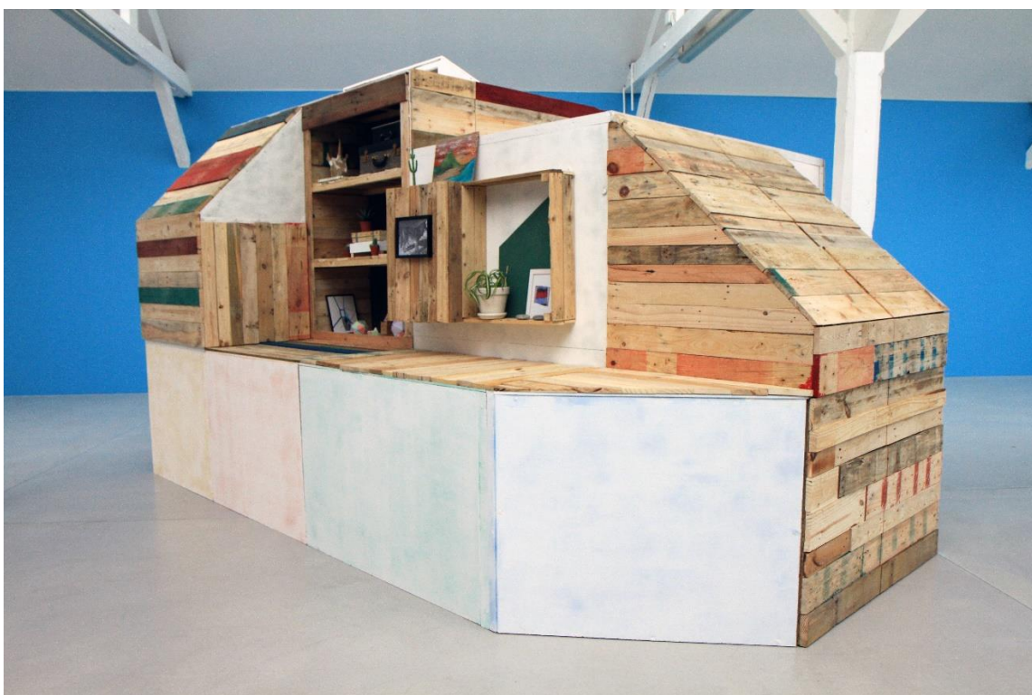
En attendant que la pluie cesse, 2014

Boîtes en bois, dessins au feutre, cactus en plastique, cierges, casque de cosmonaute, tétraèdre déployé, dimensions variables.