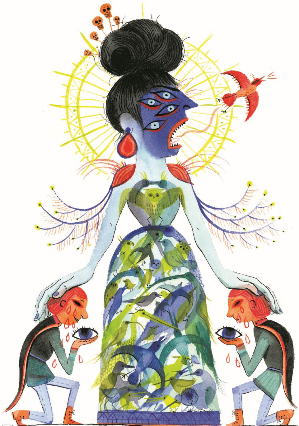
Karine Bernadou, Le chant aux mille oiseaux , 2016. Dessin et aquarelle sur papier, 29,7 x 42 cm.