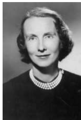
Ernestine Gilbreth Carey