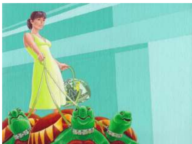
Thomas Tudoux, Insomnie (détail), peinture acrylique, 2014.