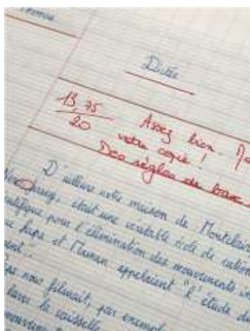
Thomas Tudoux, 14,75/20 (détail), installation, 2014.

Au regard de cette installation, la série de peintures Insomnie prolonge cette imprégnation enfantine en s'inspirant volontairement de l'esthétique surréaliste de René Magritte et d'illustrations de livres jeunesse. Alors que pour beaucoup, une des seules zones encore indemnes de la frénésie ambiante est le sommeil et les rêves qui l'habitent, cette série évoque au contraire une infiltration de notre inconscient.