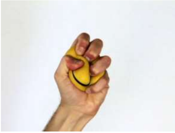
Pressé , 2011. Vidéo couleur, 3 min 6 sec Pressé est une vidéo qui présente une main malaxant un anti-stress. Tel un battement cardiaque, cette cadence imposée devient ici un rythme vital.