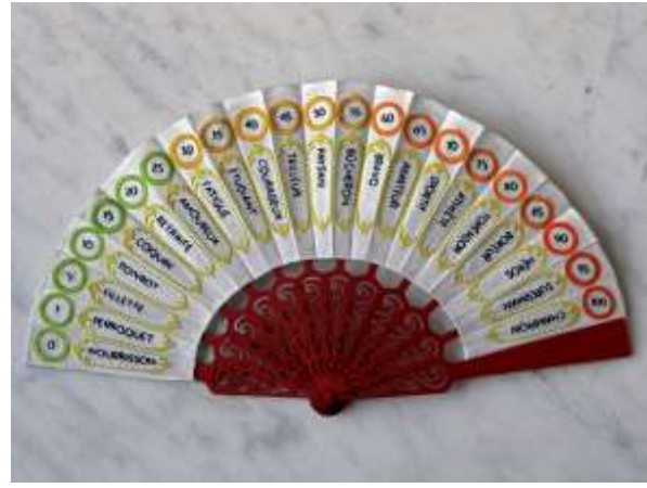
Speed Dating , 2011. Soie brodée de coton, acier peint, 43 x 23 cm. Production : Maison Jean Chevolleau, Fontenay-le-Comte Speed Dating est un éventail orné d'une échelle d'évaluation de la puissance masculine. Le motif brodé a pour origine une machine de foire servant à mesurer la force physique. Un outil de séduction féminin et la compétition virile fusionnent ici en un seul et même objet.

La pratique artistique de Thomas Tudoux est un procédé méthodique et lent ; ses créations sont souvent le résultat de gestes répétitifs. Listes, répertoires, lexiques, mais aussi broderie, actions filmées, il cerne un sujet par l'accumulation. L'hyperactivité comme fond et comme forme. Le médium et la technique sont d'ailleurs soigneusement choisis pour transmettre au mieux le propos.