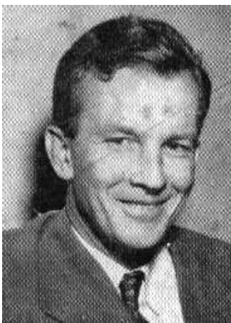
Frank B. Gilbreth Jr

Les narrateurs sont deux des enfants Gilbreth. Dans le roman, ils racontent certaines anecdotes de leur enfance et adolescence. Leur père, un homme cultivé, plein d'humour, bon vivant et surtout qui adore les enfants, au point d'être bien triste le jour où leur douzième et dernier enfant viendra au monde. Les enfants nous exposent les méthodes peu orthodoxes que leur père appliquait dans la maison, pour économiser le temps et pour inculquer certaines choses à sa progéniture. Comment apprendre une langue étrangère sans même s'en rendre compte, comment rendre amusant l'apprentissage du morse, de l'astronomie ou de la navigation. Mr Gilbreth ne manquait jamais d'imagination; et s'il pouvait être sévère parfois avec ses enfants, il ne supportait jamais de les voir tristes.