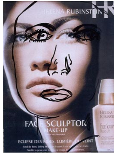
Jean-Philippe Lemée, Copies sur modèles , 2004, 62 x 47 cm, FRAC Bretagne.