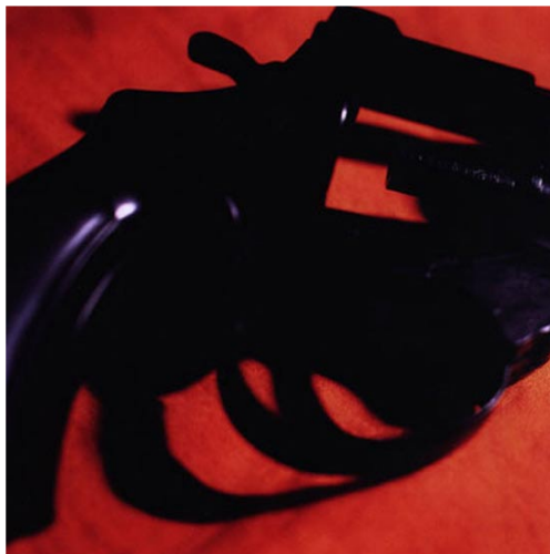
Yves Trémorin, Guns , 2000, 80 x 80 cm, FRAC Bretagne.