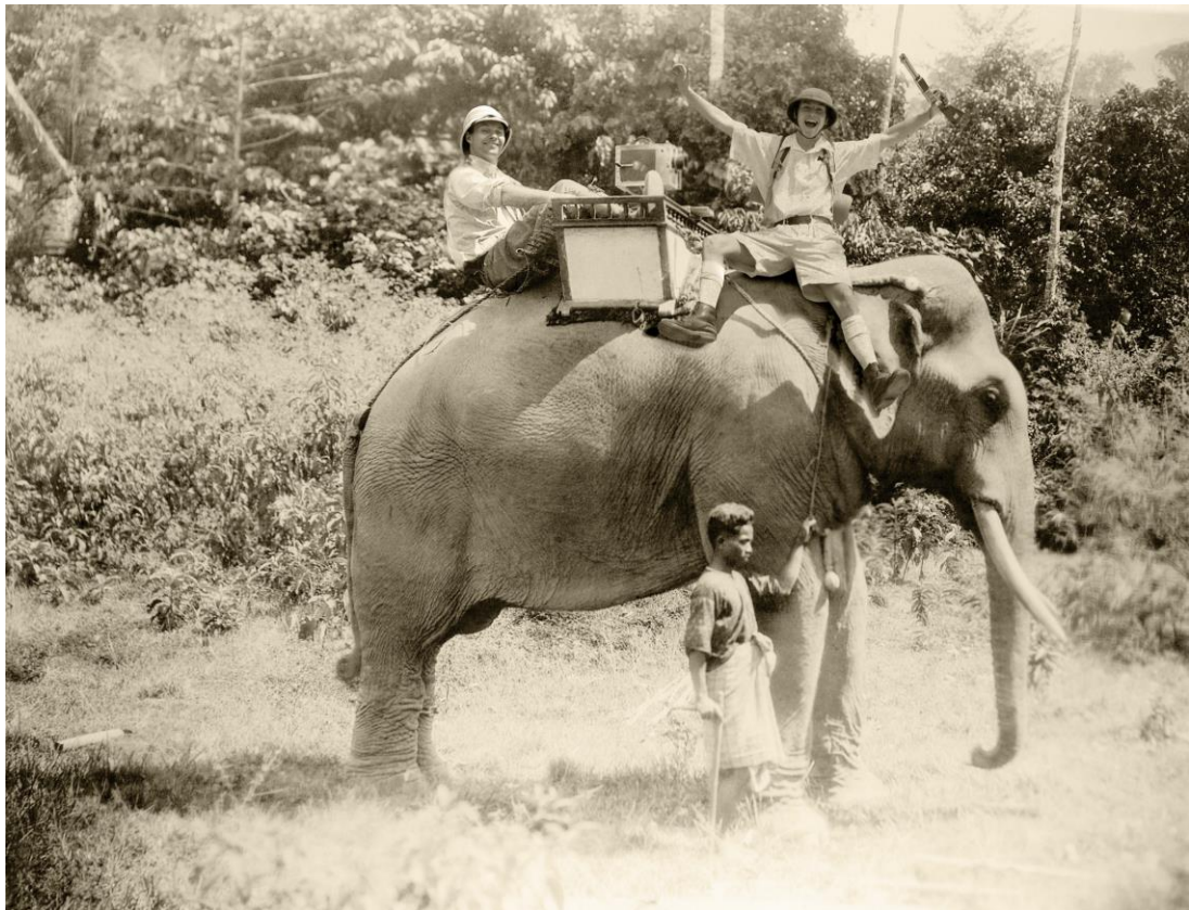
Muriel Bordier, Tourista, Les pionniers , 2014. Réalisé avec Emmanuel Reuzé.