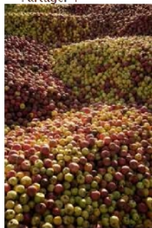
Des pommes et des hommes